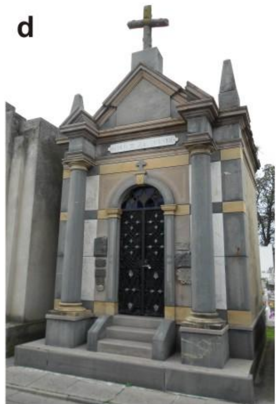
Figura 1. a y b: Estilo románico florentino; c: Estilo románico pisano; d, monumento de tipo misceláneo, donde la policromía es menos visible.