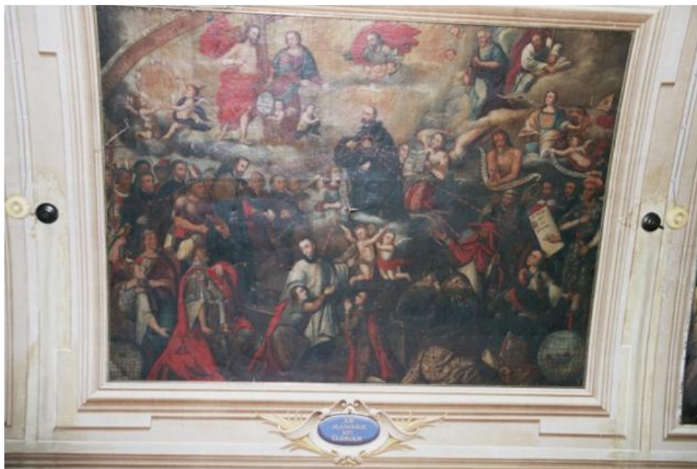
Figura 4. Glorificación de san Ignacio , anónimo cuzqueño del s. XVII. Sacristía de la iglesia de la Compañía, Córdoba. Foto de Hugo A. Pérez Campos, 2006.