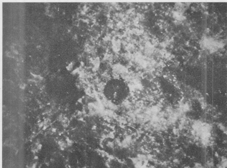
Fig. 2. — Detalle de la anterior : un granate (cristal oscuro de contornos redondeados) rodeado por individuos pequeños de feldespato de la masa fundamental de la roca. \times 15

de las superficies de la muestra se observan muchas cavidades pequeñas que por lo menos en parte no son sino los huecos dejados por minerales que desaparecieron por alteración. Observando la muestra con ayuda de una lupa resulta aún más evidente que la estructura es porfírica y que los fenocristales más numerosos son de feldespato, y aquellos raros son de granate, que son redondea-