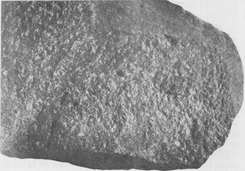
Fig. 1. — Fotografía de la muestra de andesita granatífera de Coquelén, \times 1.5 . En la superficie de fractura reciente (cara frontal) aparecen cristales redondos de granate (negros en la fotografía). Los fenocristales de feldespato (blancos en la fotografía) son bien visibles en la misma cara frontal de la muestra, y más aún en la superficie alterada que está hacia la izquierda, donde se destacan de la masa fundamental teñida de color pardo rojizo (gris oscuro en la fotografía) a causa de la alteración.

Nuestra andesita granatífera, observada de cierta distancia apa-