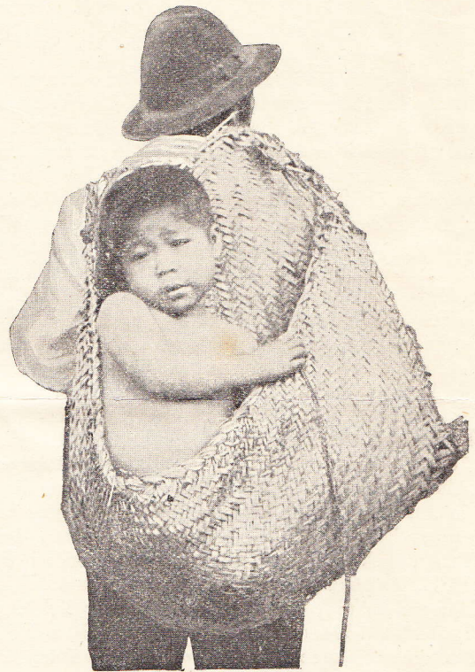
Guayaquimädchen Miguela. Leipzig.

Dieselben hier charakterisierten Merkmale wurden auch von ten Kate, dem die grofse „uniformité“ der Typen auffiel, an seinen Guayakis festgestellt.