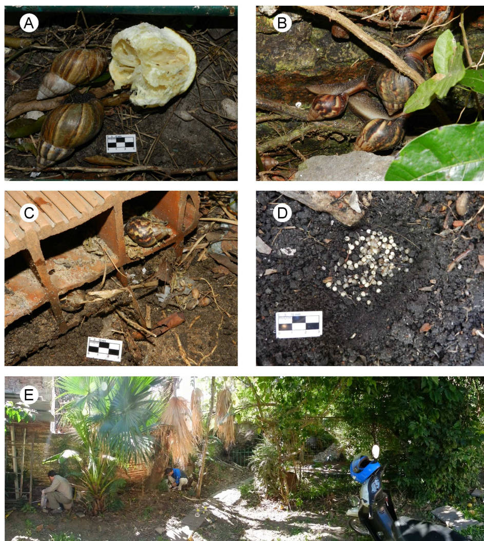
Figura 2. Ejemplares de Achatina fulica registrados en la localidad de Corrientes (Argentina). A: Alimentándose de cítricos; B: Sobre una pared húmeda, en actividad diurna; C: Refugiados en ladrillos huecos; D: Una ovada en la parcela 1 (húmeda); E: Foto panorámica (180°) mostrando el sitio de muestreo.

para el sur de Sudamérica (Vogler et al. , 2013), este hallazgo se ubica precisamente dentro de una de las áreas de mayor susceptibilidad a ser invadida por el caracol gigante africano (zona argentina limítrofe a los ríos Paraná y Paraguay). Sobre la base de la evidente dispersión de esta agresiva especie invasora y la información de riesgo de invasión con la que se cuenta (Vogler et al. , 2013), validada en parte a partir de este nuevo registro, se enfatiza la necesidad de que los organismos de aplicación locales, regionales y nacionales, realicen el monitoreo y los controles pertinentes, sobre todo en zonas limítrofes, a los efectos de detener la expansión de esta especie invasora.