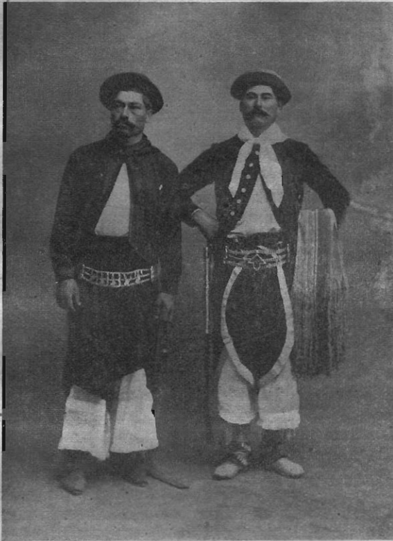
Abb. 3. Zwei Domadores.

Von den Ganchos ging der Gebrauch der Bota zu den Indianern über, welche ihn vordem nicht kannten; für die Indianer südlich der Stadt Buenos Aires läßt sich die Bota seit der Mitte des 18. Jahrhunderts