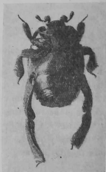
Terapus Bickhardti BAUCH. Vista dorsal y ventral, con diez aumentos