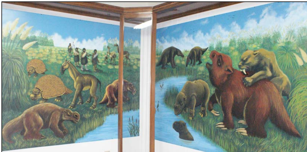
Murales que se exhiben en el Complejo Histórico junto a los restos fósiles localizados en Chivilcoy.

En torno a los 9.000 años se produce una fuerte elevación de la temperatura media, en Argentina fue entre 3° C y 4° C más alta que la moderna. Esta alternancia entre climas cálidos y húmedos a los más áridos, en los que no incidió el hombre, habrá de suceder. Por ejemplo, entre el descubrimiento de América y las primeras décadas del año 1.800, en grandes área del sur de Sudamérica prevalecieron condiciones áridas o semiáridas.