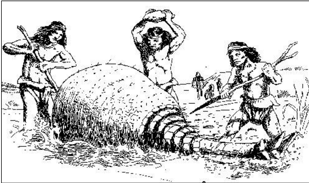
Indígenas atrapando un gliptodonte.

hombre ya convivía con ellos, provocó un vacío definitivo en los ecosistemas de América del Sur.