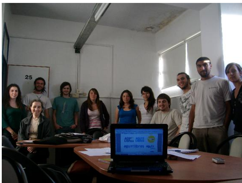
Algunos de los miembros del grupo de voluntariado durante la realización de una jornada de trabajo