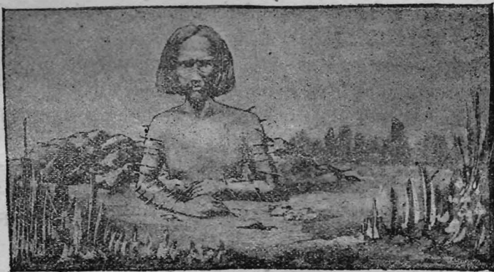
Rito funerario de los Minuanes

Las cuestiones personales se arreglaban entre las partes sin consecuencias graves, generalmente á trompadas.