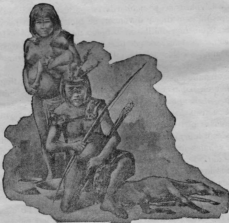
UNA FAMILIA MINUANA

Restauración hecha según los datos que se tienen