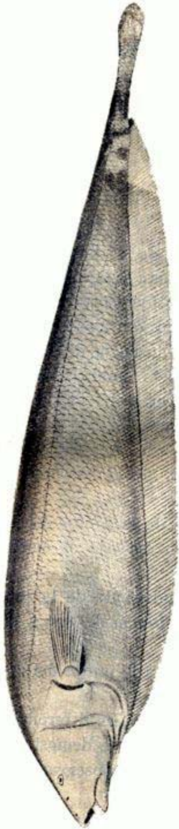
Morena Negrá. Stermarchus albifrons (L.) Bl. Schn.