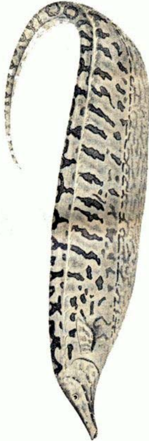
Morenita. Rhamphichtys rostratus (L.) Müller & Troschel.