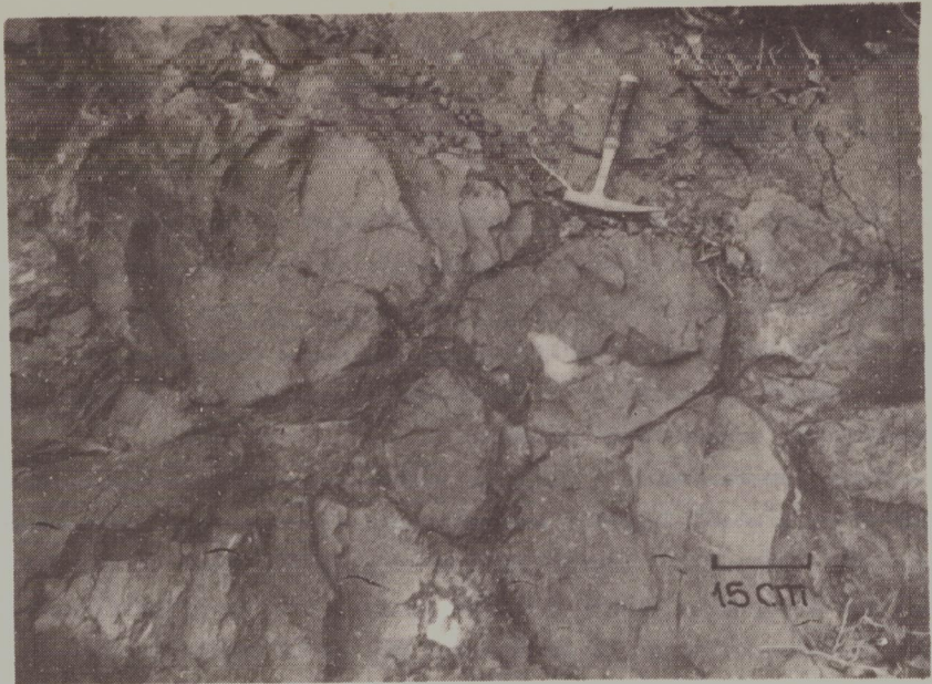
FOTO 1 - Lavas en almohadillas mostrando sus contornos y el material lutítico entre las mismas. Cuesta del Viento - Rodeo. (Detalle de FOTO 2).