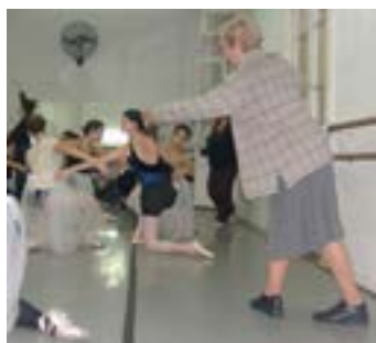
ENSAYOS del Ballet Infantil y del Ballet Clásico de la Escuela de Danzas Clásicas de La Plata.