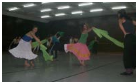
ENSAYOS del Ballet Contemporáneo de la Escuela de Danzas Clásicas de La Plata.