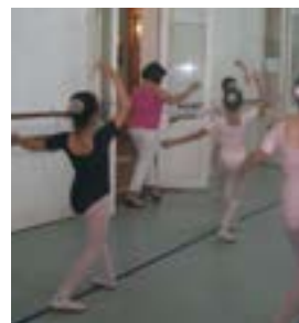
Primeros años de CLASES de Danzas Clásicas en la Escuela de Danzas Clásicas de La Plata.