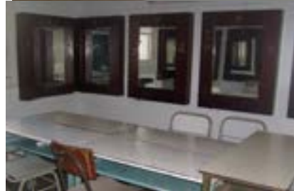
ESPACIOS de la Escuela de Danzas Clásicas de La Plata.