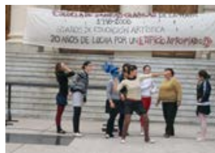
“POR UN EDIFICIO APROPIADO”. Manifestaciones de la Escuela de Danzas Clásicas de La Plata.