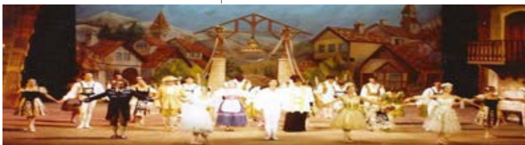
HISTORIA. Distintos momentos de la Escuela de Danzas Clásicas de La Plata.