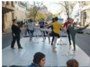
“POR UN EDIFICIO NUEVO”. Manifestaciones de la Escuela de Danzas Clásicas de La Plata.