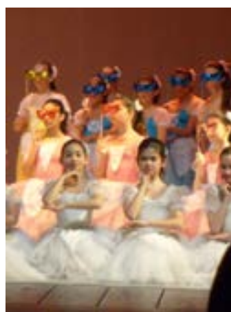
FUNCIONES. Alumnas y alumnos de la Escuela de Danzas Clásicas de La Plata.