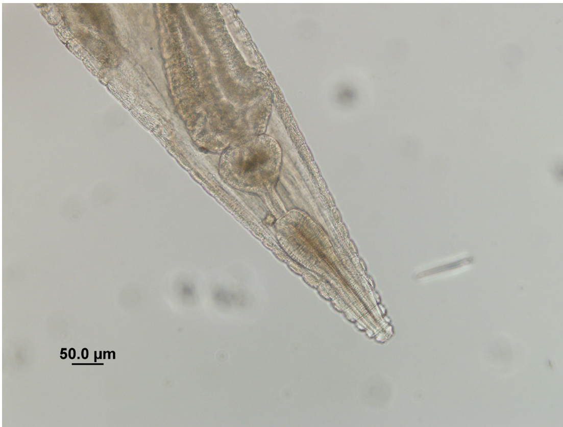
Figura 4: Extremo anterior de una hembra del género Blattophila

El primer grupo de nemátodos hallado corresponde al género Blattophila (Fig. 4), se caracteriza por presentar ocho papilas cefálicas, el estoma muy corto con una placa y un diente, anfidios pequeños, el ala lateral visible a lo largo del cuerpo, que se origina cerca del extremo anterior del intestino y que termina en la base del apéndice caudal, el esófago consiste en un corpus claviforme fuerte y muscular que se ensancha ampliamente en el extremo anterior y ligeramente ensanchado en la parte posterior, un istmo estrecho, y el bulbo basal con valvas, el poro excretor se ubica cerca de la base del bulbo basal, el anillo nervioso situado en el extremo anterior del corpus. Intestino dilatado en el extremo anterior. Vulva situada anterior al punto medio del cuerpo, protuberante, con un labio desarrollado. Una larga vagina unida a un útero único común situado anterior a la mitad del cuerpo. Dos ovarios, dirigidos hacia adelante y reflejados posteriormente. Huevos ovoides con uno opérculo polar simple. Apéndice caudal largo y filiforme. Hallamos dos especies de este género.