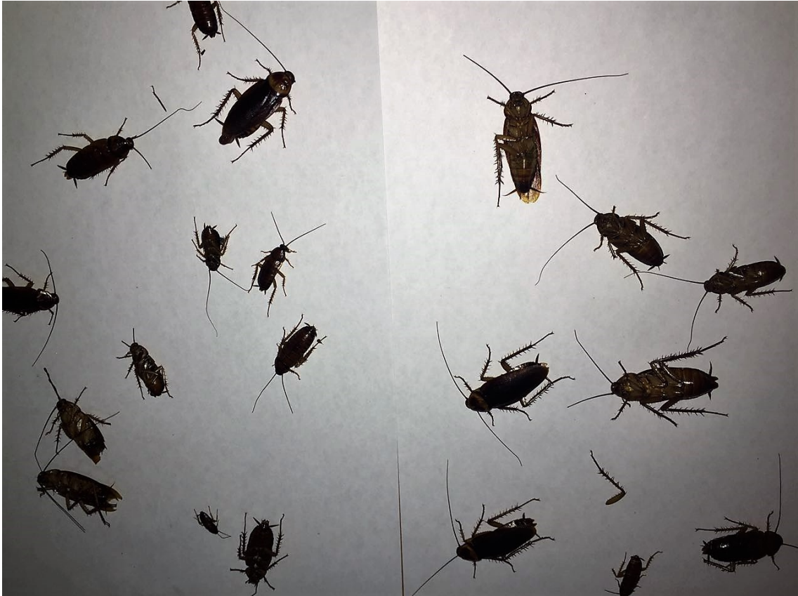
Figura 2: ninfas y adultos de Periplaneta americana , obtenidas en una captura.