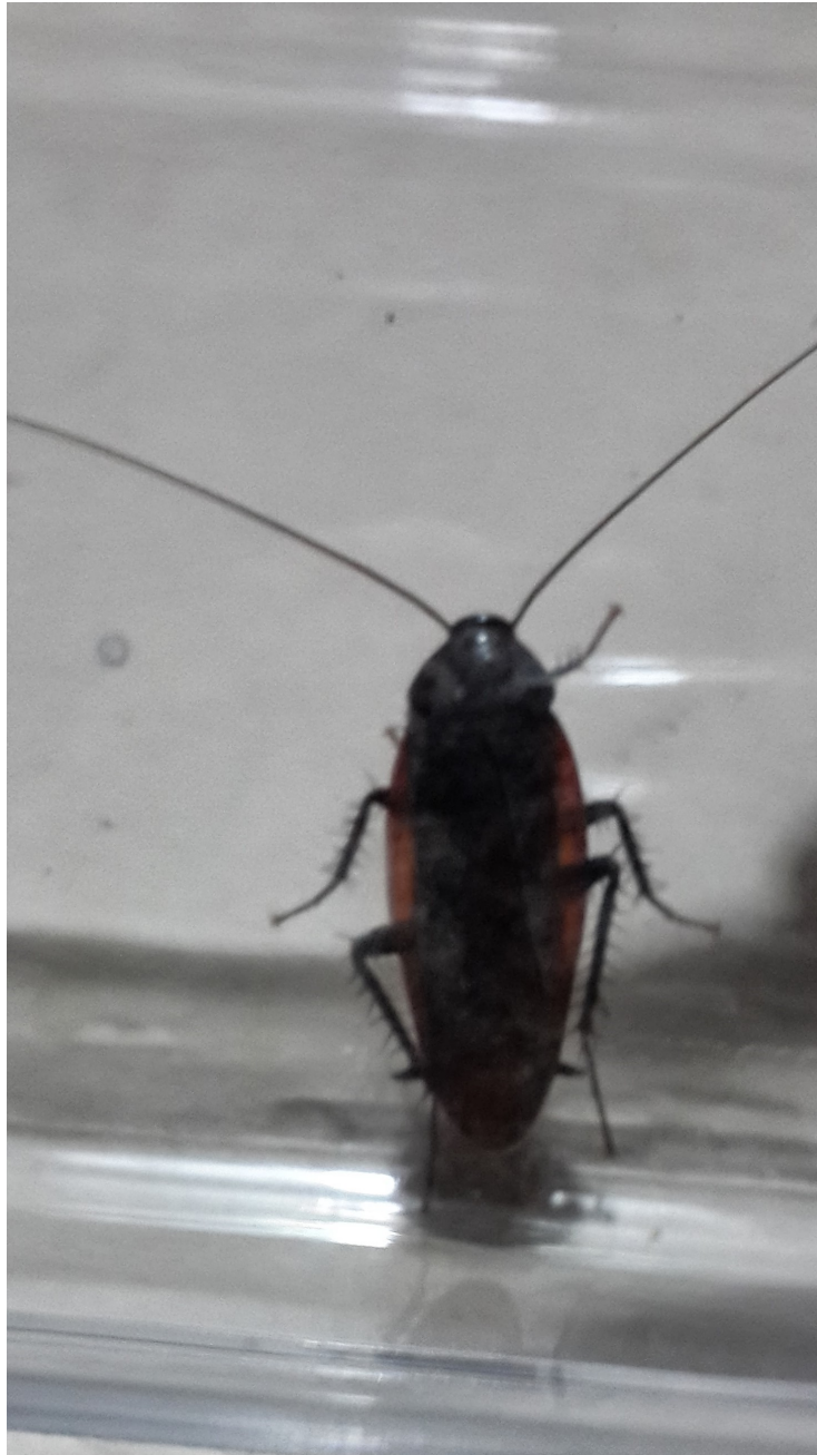
Figura 1: adultos de Periplaneta americana