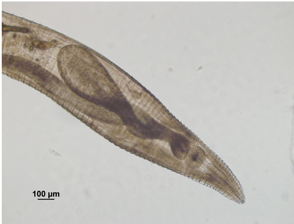
Figura 5: Extremo anterior de una hembra del género Leidyneema .

cardias, e inmediatamente forma un largo ciego. Vulva situada cercana a la mitad del cuerpo, anfidelfica. Los huevos ovalados. El apéndice caudal largo y delgado.