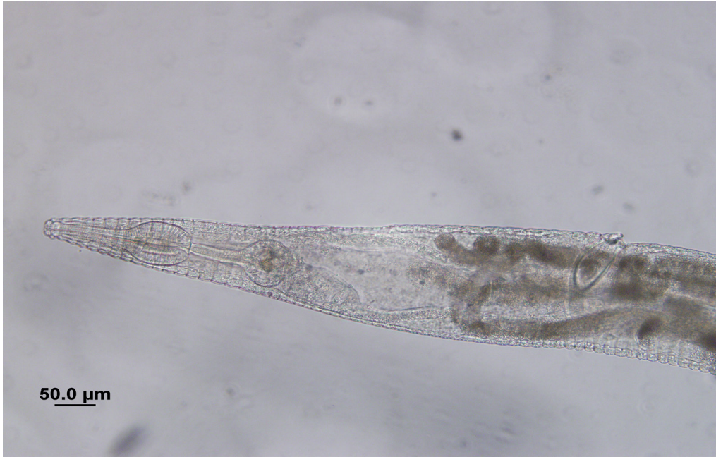
Figura 6: Extremo anterior de una hembra del género Hammerschmidtella .

Finalmente la cuarta especie encontrada fue Thelastoma domesticus Camino & Quelas (Fig. 7), la hembra con un cuerpo fusiforme y grueso. Extremo anterior del cuerpo formado por un anillo peribucal y un segundo anillo ensanchado. Boca rodeada por ocho papilas labiales. Anfidios pequeños y piriformes. El estoma con una única pared gruesa, muy cuticularizada, formando tres pares de nodos en dos filas, sin dientes. Corpus esofágico cilíndrico, con un corto istmo y bulbo basal posterior con valvas. El poro excretor de poro se ubica a nivel del inicio del intestino. Vulva protuberante que se encuentra cerca de la mitad del cuerpo, vagina muscular, paralela al eje longitudinal del cuerpo y que se divide en dos porciones: la vagina vera y la vagina muscular, anfidelfica, dos ovarios. Los úteros divergentes. Los huevos ovalados, con la cáscara lisa, sin ornamentación, dispuestos individualmente en forma desordenada, y no embrionados. El apéndice caudal es largo y filiforme.