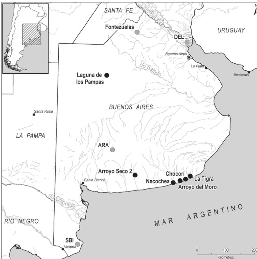
Figura 1. Ubicación geográfica de las muestras de las pampas argentinas: Ara: Araucano, Del: Paraná Delta, SBI: San Blas (negro=muestras tempranas; gris=muestras tardías). La muestra de Fontezuelas fue incluida en el mapa porque fue ampliamente discutida en trabajos previos, pero nótese que está fechada en el Holoceno tardío.

sobre hueso humano fechado de manera directa en sitios arqueológicos argentinos (para excepciones véase Cornero et al., 2014). Todas las muestras de las pampas argentinas fueron datadas directamente mediante AMS ^{14}\text{C} en distintos laboratorios, muchas recibieron tratamiento especial debido a su relevancia y potencial antigüedad, en el cual se discriminó los aminoácidos más abundantes y estables. Dos de ellas (La Tigra y Chocorí) fueron tratadas previamente por Tom Stafford (quien discriminó los aminoácidos más abundantes y estables para ser datados) y luego fueron enviadas al Lawrence Livermore del National Laboratory's Center para análisis mediante AMS (Politis et al., 2011).