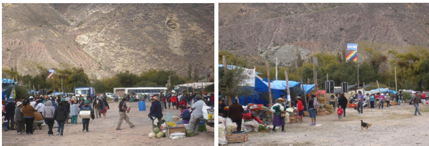
Figura 6. 19ª Edición de la Feria del cambalache y trueque, Juella (Abril 2015)

Puna (Movimiento Nacional Campesino Indígena), y tiene la particularidad de realizarse una vez por año, en las distintas comunidades que integran la Red; este año (2015) se llevó a cabo la 19ª Edición de la Feria en la comunidad de Juella (El Churcal) en el mes de Abril (Figura 6). Por lo general se realiza al igual que el festival antes mencionado coincidiendo con la época de cosecha de “durazno”.