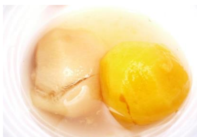
Figura 4. Jugo o compota de durazno con “durazno” blanco y amarillo común.

Existen relatos de pobladores sobre la preferencia de elaborar pelones con los duraznos comunes, ya que al exponerlos al sol tardan en secar menos días. Los pelones se almacenan en cajas de cartón para su conservación posterior.