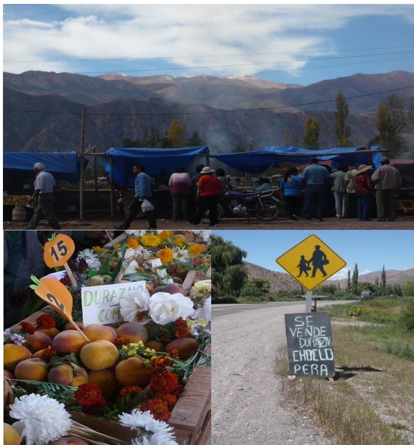
Figura 5. Distintas expresiones relacionadas con el cultivo de duraznos a. Festival del durazno en Juella (Abril 2014), b. cajones de duraznos que se expone al jurado en el festival, c. carteles donde se expone la venta de durazno