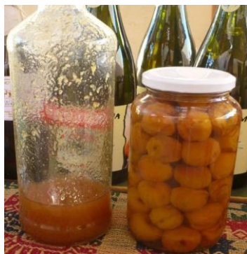
Figura 2. Licor de durazno e duraznos en almíbar.

Pelones de duraznos (Figura 3): Se emplean los “duraznos” que se han caído en los terrenos de cultivo, “duraznos de pelar”. Se les quita el epicarpo, se parten por la mitad (quedando en forma de orejones) para que se sequen mejor o se los deja enteros. Durante varios días son expuestos al sol para deshidratarlos y concentrar azúcares. Con estos pelones se prepara anchi, “mocochinche” y compota (Figura 4).