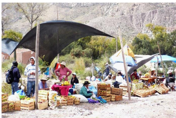
Figura 7. Puesto y productos que en la Feria del cambalache y trueque, Juella (Abril 2015), a. productores de la Puna y b. productores de Quebrada