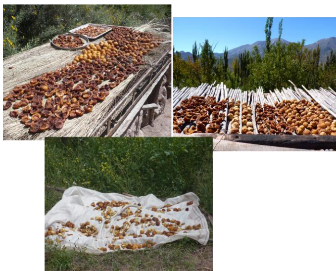
Figura 3. Secado de “pelones” de durazno.

Pelones de duraznos (Figura 3): Se emplean los “duraznos” que se han caído en los terrenos de cultivo, “duraznos de pelar”. Se les quita el epicarpo, se parten por la mitad (quedando en forma de orejones) para que se sequen mejor o se los deja enteros. Durante varios días son expuestos al sol para deshidratarlos y concentrar azúcares. Con estos pelones se prepara anchi, “mocochinche” y compota (Figura 4).