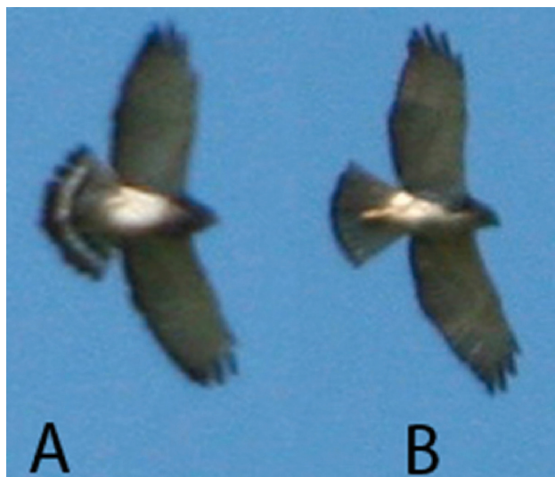
Figura 1. Aguiluchos Alas Anchas ( Buteo platyterus ) en la Serranía de Tartagal, Salta, el 13 de diciembre de 2009. A: Adulto; B: Juvenil.