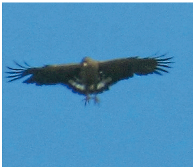
Figura 2. Adulto de Águila-cinzena ( Buteogallus coronatus ) con comportamiento de "peneirar", Palmas, Paraná (Brasil), 8 de maio de 2015.