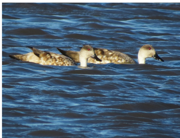
Figura 3. Dos de los nueve Patos Crestón ( Lophonetta specularioides ) observados en cercanías de Villa Epecuén, partido de Adolfo Alsina, provincia de Buenos Aires, el 31 de julio de 2015.