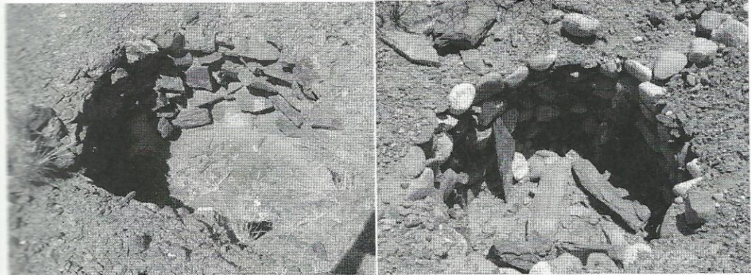
Figura 2: Cistas de El Churcal construidas con diferente materia prima.

de formas y tamaños relativamente homogéneos, incluyendo las lajas de mayor tamaño usadas en los techos, y en algunos casos en la base de las paredes. Este material, accesible en afloramientos naturales cercanos al sector del sitio emplazado en la parte superior del pie de monte, también se usó para revestir las paredes de cierta proporción de cistas