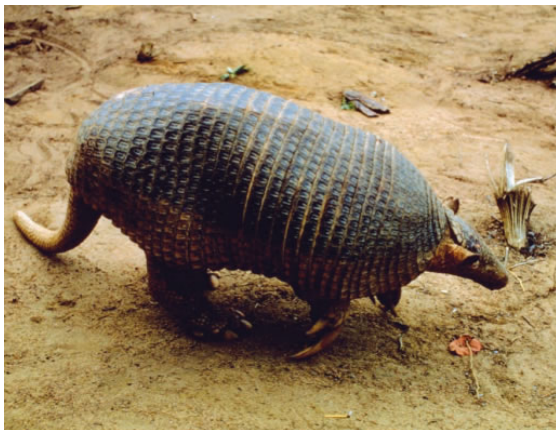
Priodontes maximus

El tatú carreta ( Priodontes maximus ) es el más grande de los representantes vivientes de la familia Dasypodidae, que incluye a los mamíferos acorazados conocidos como peludos, mulitas y quirquinchos. Denominado por los guaraníes “tatú guazú” (=armadillo grande), puede alcanzar en condiciones naturales más de 1,5 m de largo total y un peso de 40 kg. Como otros miembros de su familia, su cuerpo está cubierto por un caparazón móvil formado por placas óseas y córneas, y sus dedos poseen fuertes garras curvas. Gracias a la combinación de dicho caparazón con su gran tamaño y fuerza, los adultos tienen pocos depredadores, que incluyen a los grandes félidos como yaguararé y puma.