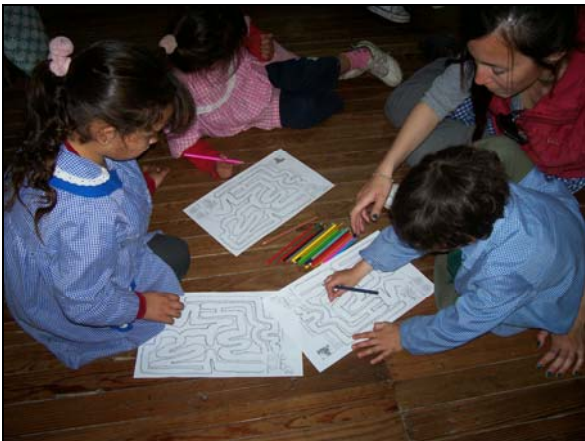
10 Buscando el camino