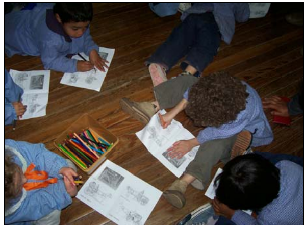
11 Coloreando carritos