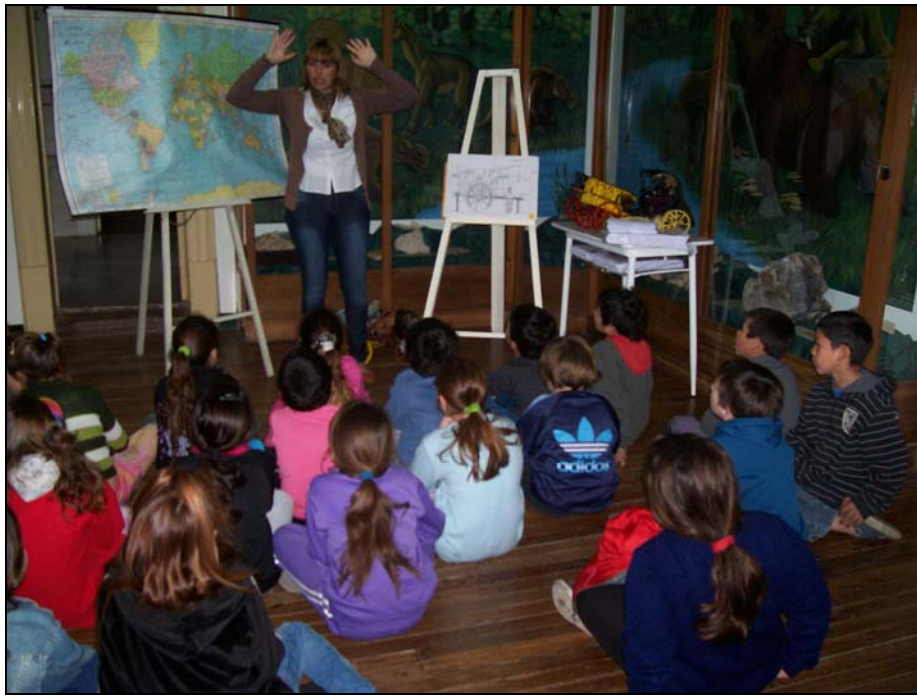
9 En pleno taller