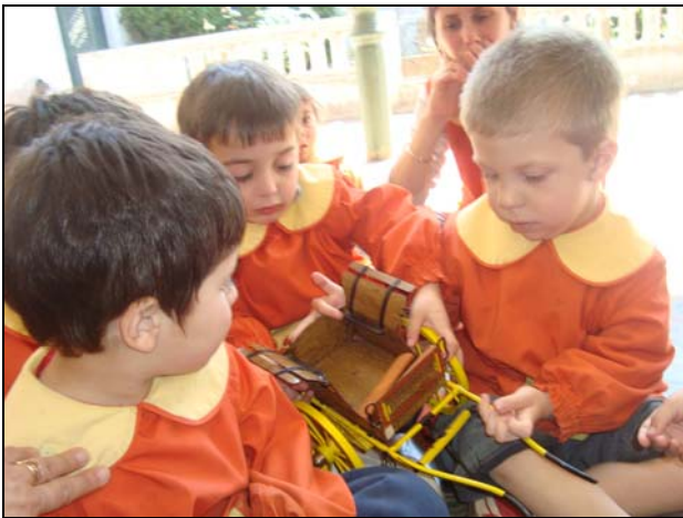
6 Sulky mariposa

La colección Galante se utilizó para diseñar el taller dirigido a alumnos de nivel inicial y 1r. ciclo. El objetivo es reconocer medios de transporte traccionados a sangre comparándolos con los actuales. Al contacto directo con los carruajes a escala reducida, se aprecian las formas y el diseño de acuerdo al uso. Como material didáctico, de acuerdo a la edad, se complementa con “sopa de letras”, “laberinto”, cuadernillo para colorear. Observación escala real de coupe clearance y sulky mariposa. De esta manera se logra recrear un pretérito paisaje cultural que coadyuva a rescatar y transmitir valores patrimoniales.