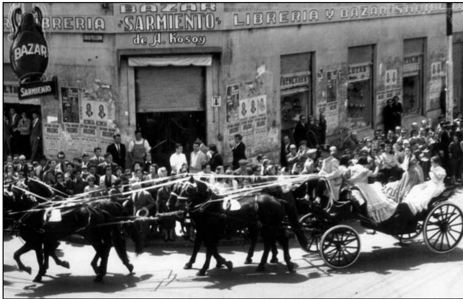
4 Landó. Desfile Día de la Tradición

Los registros del archivo municipal, referidos a las patentes de rodados, nos permiten tener una visión de los diferentes carruajes usados. Por ejemplo en 1913 estaban discriminados en carruajes particulares, de plaza, carros y chatas, y otros medios. Los primeros se referían a los automóviles, landó, coupé, vis a vis, victorias, americanas de dos y cuatro asientos, milord, berlina, break, phaeton, tilburys, dog-car, charret, sulky, jardineras; algunos de los mencionados se utilizaban como carruajes de plaza o alquiler. Luego se mencionan a los carros, jardineras de reparto, chatas o break mixtos de carga o pasajeros, y a los carros y chatas cuyas cargas podían exceder los 3.500 kg. Por último se mencionan a las diligencias, galeras y otros rodados tales como la motocicletas y bicicletas. En el Complejo Histórico se conserva una colección de patentes de la mayoría de los carruajes mencionados, muchas de las cuales se exhiben.