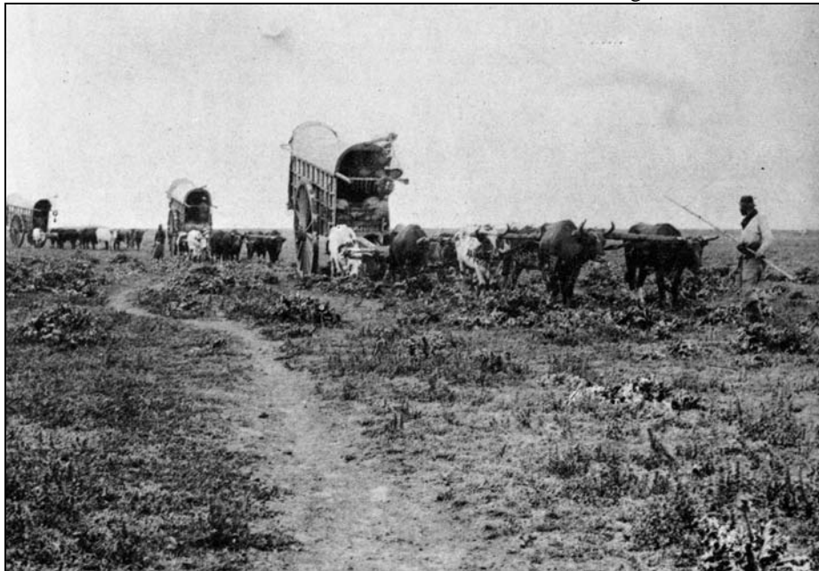
2 Carreta toldada. Sociedad Fotográfica Argentina de Aficionados