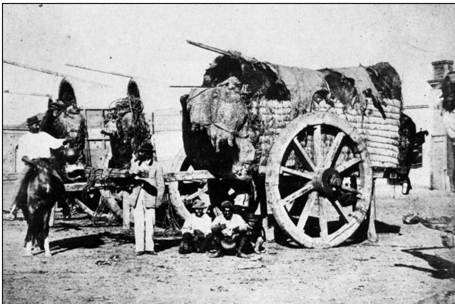
3 Carreta quinchada y toldada.