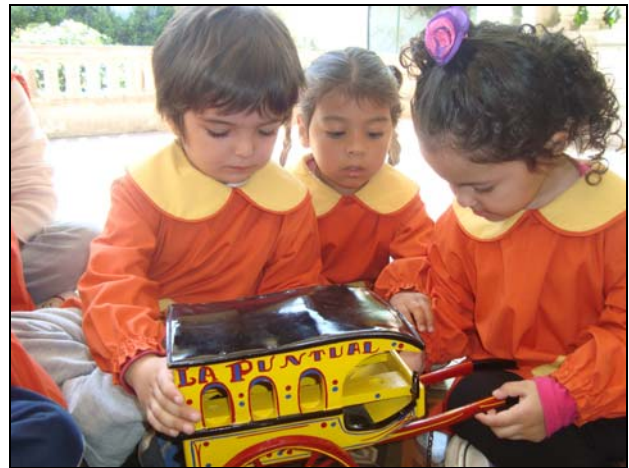
7 Carro lechero