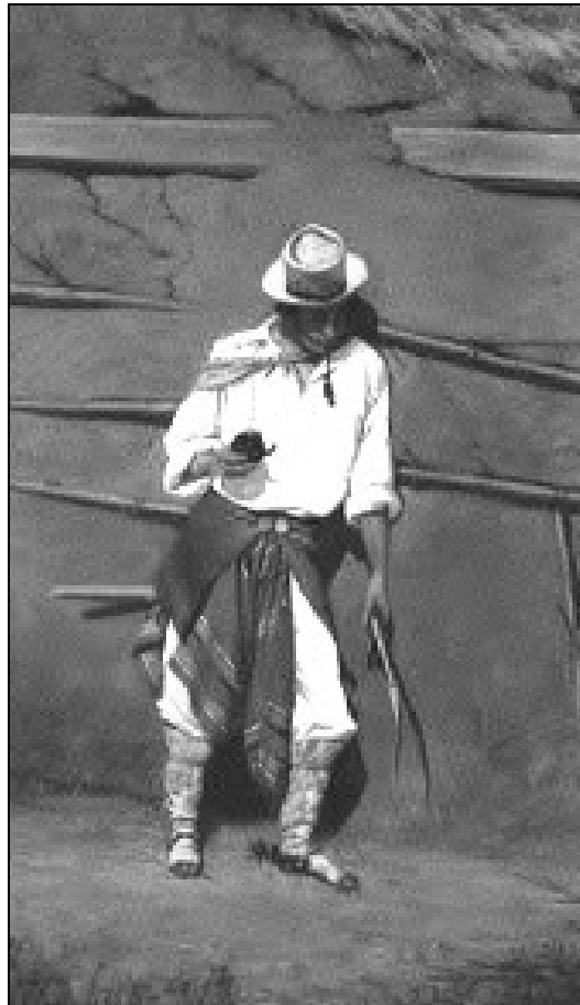
Lámina 5: chiripá y bota de potro. Óleo de J. M. Blanes

Se distribuirá a cada alumno un cuadernillo con la impresión del documento analizado y que contiene además un sector en blanco para que cada uno dibuje, con lápices de colores, a Zalazar con la vestimenta de la época (chiripá y bota de potro), culminando con la firma del alumno con pluma de ave y/o metálica con tinta.