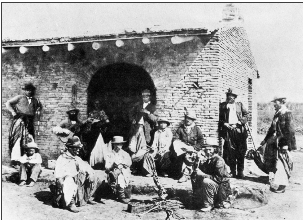
Lámina 6: Paisanos siglo XIX posando para la foto. B. Panunzi.