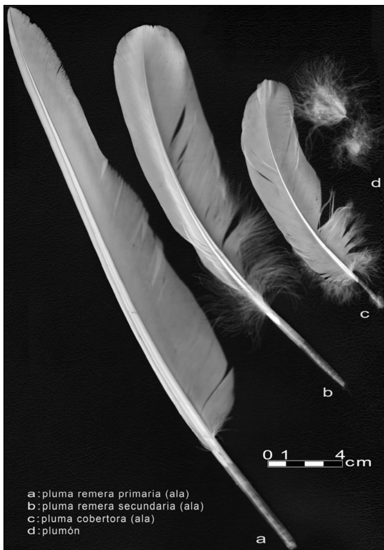
Lámina 1: Plumas de ganso

En la pluma de ave, el eje central se denomina raquis y la porción inferior, más ancha y hueca, se designa cálamo. En los márgenes laterales del raquis se desarrolla una estructura a manera de lámina dividida en dos partes opuestas, asimétrica si consideramos las remeras primarias. Las plumas del ala izquierda son preferidas para escribir por los diestros porque está curvada, hacia el extremo distal, a la izquierda y alejada de la mano que la sostiene. El cálamo, al introducirlo en tinta, actúa como depósito, fluyendo de esta manera el líquido hacia la punta por capilaridad.