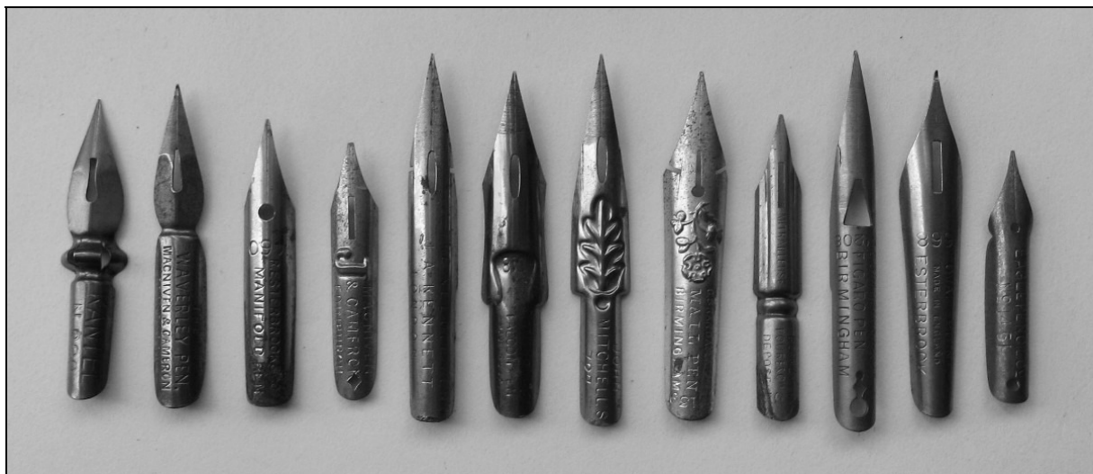
Lámina 3: Plumas metálicas

Para que esto sea posible es necesario acondicionar la pluma del ala, preferentemente de ganso o cisne, a través de los siguientes pasos Lámina 4: