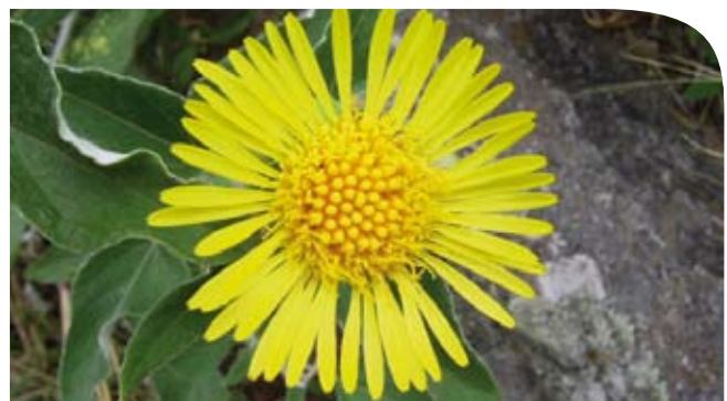
La "margarita de las sierras", Microliabum candidum (Griseb.) H. Rob. (Asteraceae-Liabeae)

Argentina cuenta con un Comité de la UICN, creado en el año 1990, con sede en la ciudad de Puerto Madryn (Patagonia, Provincia de Chubut), que actualmente agrupa a doce miembros,