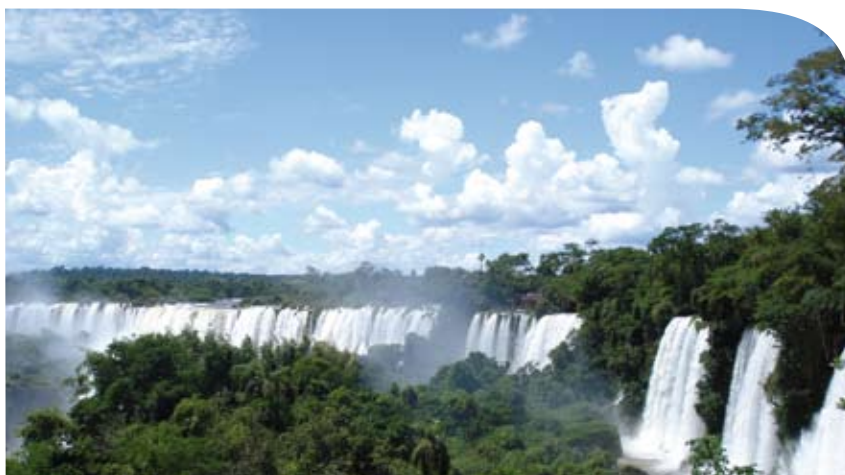
Misiones, selva paranaense.

A pesar de las dificultades y desarrollo tardío de proyectos y programas de conservación de la diversidad vegetal en Argentina el futuro es promisorio o debiera serlo. Esta mirada se basa en los logros actuales relacionados con esta temática: la organización ininterrumpida desde su inicio del Congreso Nacional de Conservación de la Biodiversidad (Buenos Aires 2006, 2008, Tucumán 2010); la organización de entidades nacionales con planes de acción que involucran la conservación de la diversidad vegetal argentina (por ejemplo, la Red Argentina de Jardines Botánicos), la existencia de proyectos vinculados con la temática (Programa Nacional de Gestión de la Flora, proyecto PlanEAR, etc.), la generación de leyes nacionales como la Ley de Bosques, en desarrollo actual en el país, la concreción del Catálogo de las Plantas Vasculares del Cono Sur (2008), entre otros. Por supuesto, quedan cuestiones pendientes y aún puntos débiles como la articulación de los proyectos nacionales con los regionales, provinciales y locales, la mayor participación de los diferentes actores involucrados en esta problemática como las universidades, los centros científicos y organismos gubernamentales y no gubernamentales, así como un compromiso de toda sociedad con