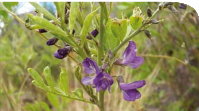
El "poroto del campo", Apurimacia dolichocarpa (Griseb.) Burkart (Fabaceae-Papilionoideae)

Argentina carecía de un trabajo florístico completo que cubra la totalidad del país, hasta que en los años 1994, 1996 y 1999 se publican secuencialmente los tres tomos de "El Catálogo de las Plantas Vasculares de la República Argentina". Luego, en el año 2008, aparece "El Catálogo de las Plantas Vasculares del Cono Sur" (Zuloaga et al. , 2008), el cual completa y actualiza al primero. Este Catálogo, si bien no contiene información precisa sobre la distribución de las especies vegetales ni datos ecológicos y demográficos de las mismas, ofrece un marco de referencia apropiado para la generación de proyectos de conservación de las plantas de la región. Argentina no posee aún una Flora completa y actualizada que cubra toda la superficie nacional (si bien el proyecto "Flora Argentina" está en curso). Las floras publicadas existentes en el país son regionales, provinciales o locales y muchas de ellas aún no están terminadas. Por otra parte, estas obras carecen en general de referencias con respecto al estado de conservación o amenaza de cada especie. No obstante, constituyen un buen punto de partida y de referencia para estudios conservacionistas.