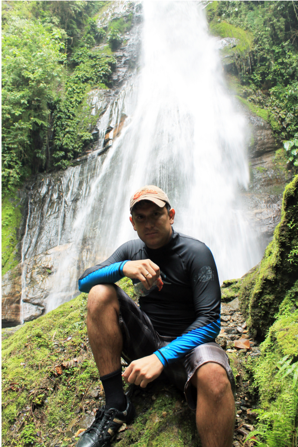
Sierra Nevada de Santa Marta, Sector de San Lorenzo, Cascada en la parte alta del río Gaira, Colombia, 2012