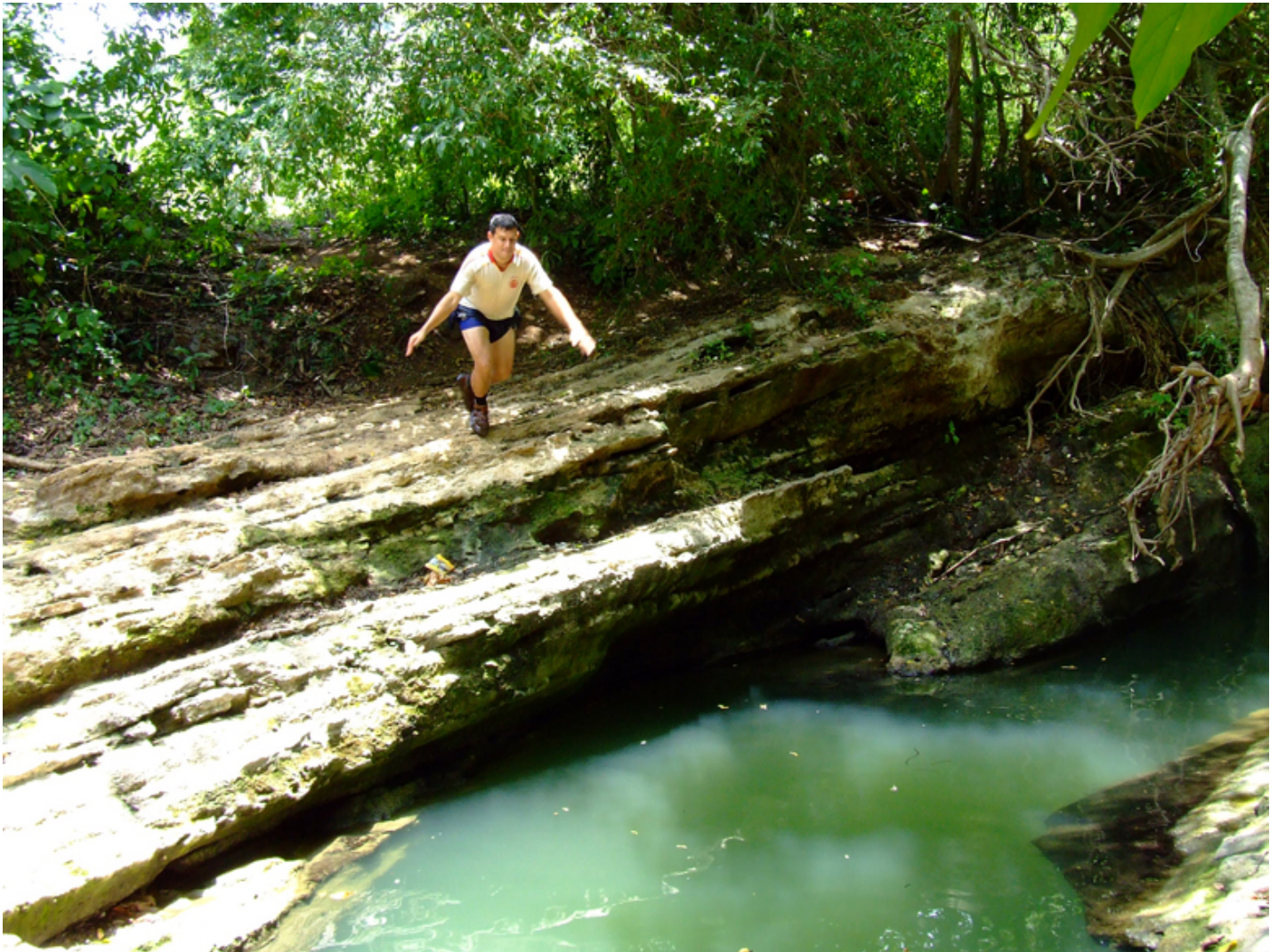
Un arroyo permanente en el Departamento del Atlántico, Corregimiento Corral de San Luis en Tubará, Colombia, 2013