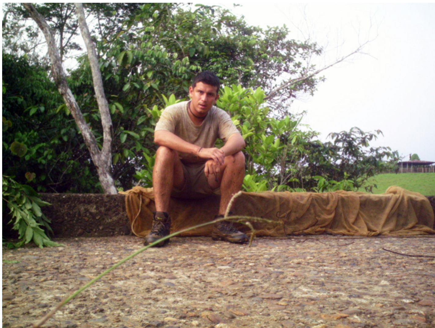
Expedición ictiológica al Alto Amazonas, sector Puerto Leguizamo, Departamento del Putumayo, Colombia, 2008