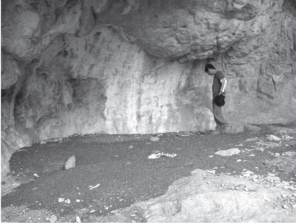
Figura 3. Vista del interior de la cueva 1 de la laguna 2, La Gruta.

cercana, a la que en la actualidad se acercan los guanacos ( Lama guanicoe ). En un sondeo inicial se obtuvo un fechado de 10656 \pm 54 años AP (AA76792) (Franco y Cattaneo 2009).