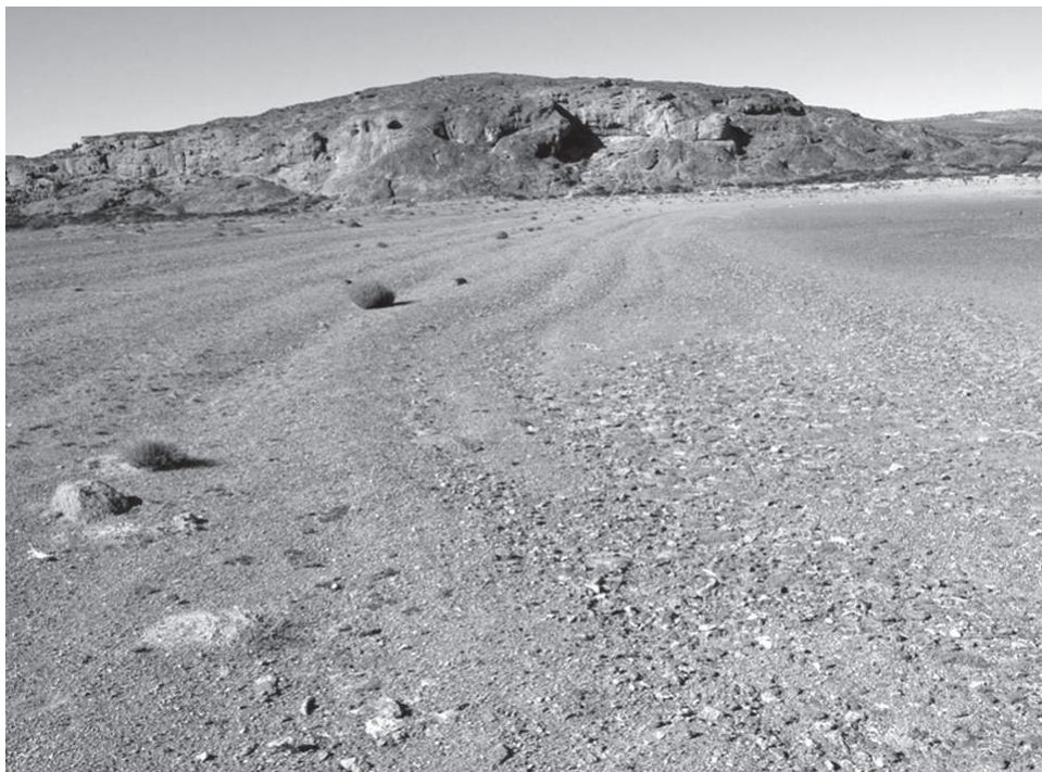
Figura 2. Vista de niveles antiguos de la laguna 2. Al fondo puede verse la pequeña cueva sondeada.

Ambas lagunas han tenido variaciones en su disponibilidad de agua, tal como atestigua la presencia de ramas y troncos en los bordes de la laguna 1 (Franco y Cattaneo 2009) -que marcan la línea de resaca- y de antiguas líneas de costa de la laguna 2 (figura 2). En proximidades de las mismas se realizaron muestreos de materias primas, transectas, sondeos y relevamientos de arte rupestre.