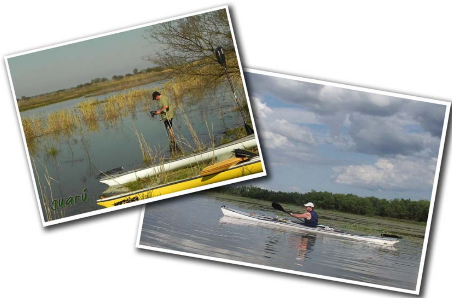
Curioseando por las islas frente a Rosario, 2013