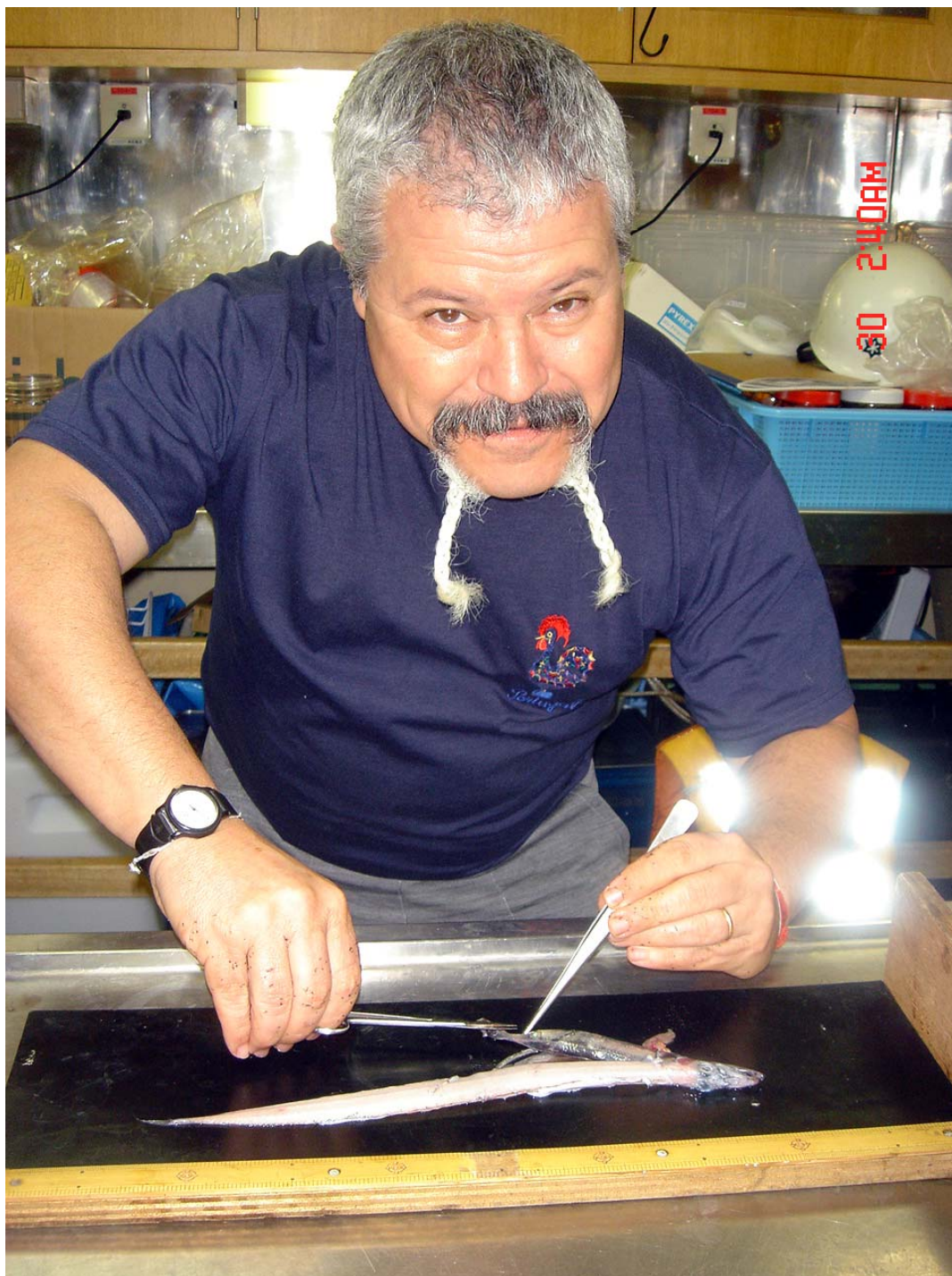
Evaluación de juveniles de calamar Campaña Internacional Atlántico Sudoccidental, R/V Kayio Maru, 2005