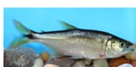
Oligosarcus jerymsii (dentado)