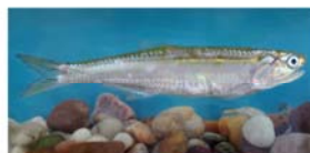
Lycengraulis grossidens (anchoa de río)