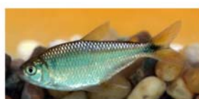
Astyanax eigenmanniorum (mojarra)