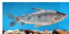
Leporinus obtusidens (boga)