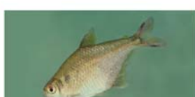
Hyphessobrycon nicolasi (mojarra)