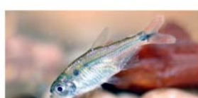
Hyphessobrycon togoi (mojarra)