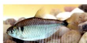
Hyphessobrycon luetkeni (mojarra)