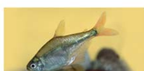
Hyphessobrycon meridionalis (mojarra)