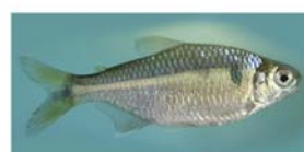
Bryconamericus iheringii (mojarra)