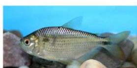
Astyanax asuncionensis (mojarra)