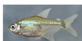
Cheirodon ibicuiensis (mojarrita)