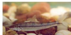
Apareiodon affinis (virelito)