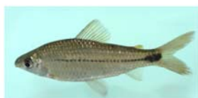
Steindachnerina biomota (sabalito)