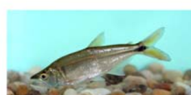
Oligosarcus hepsetus (dentado)