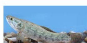
Hoplias malabaricus (tararita)