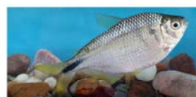
Astyanax abramis (mojarra)