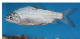
Prochilodus lineatus (sábalo)