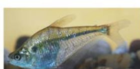
Charax stenopterus (dentado transparente)