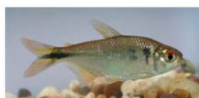
Astyanax sp. (mojarra)