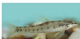
Characidium tenue (tritolo)