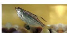
Pseudocorynopoma donae (mojarra de velo)