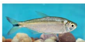
Astyanax aramburui (mojarra)