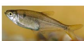
Diopoma terofali (mojarra)