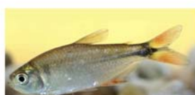
Hyphessobrycon anisitsi (mojarra)