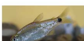
Cheirodon interruptus (mojarrita)