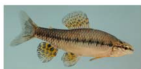
Characidium rachovi (tritolo)