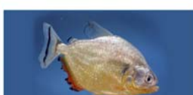
Senosalmus maculatus (palometa)