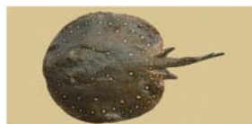
Potamotrygon motoro (raya de río)