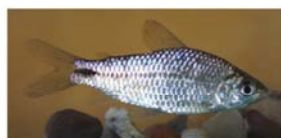
Cyphocharax spilatus (sabalito)