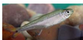
Bryconamericus stramineus (mojarrita)