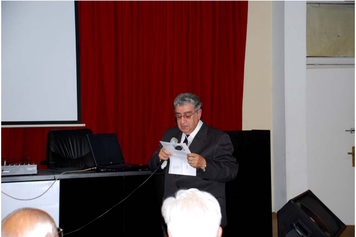
Discurso de su Incorporación a la Academia Nacional de Farmacia y Bioquímica

2012 - Congreso Argentina Ambiental (Congreso Internacional de Ciencia y Tecnología Ambiental - I Congreso Nacional de la Sociedad Argentina de Ciencia y Tecnología Ambiental). Miembro, Comité Científico Nacional. Mar del Plata, Mayo 28-Junio 1°.