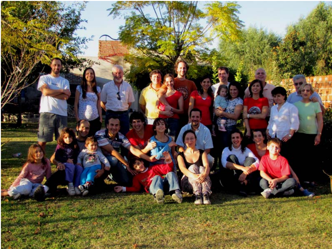
Grupo casi completo de integrantes del Laboratorio Ecofisiología Aplicada, UNLu, con apéndices (conyugues, novios/as, hijos/as)