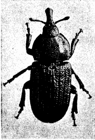
Oxycorynus parvulus Bruch (8 × aumentado)

Las antenas son espesas, algo más cortas que el rostro; el segundo artículo es subgloboso, el tercero algo más ancho que largo, los siguientes netamente transversales, disminuyendo de largo y aumentando de