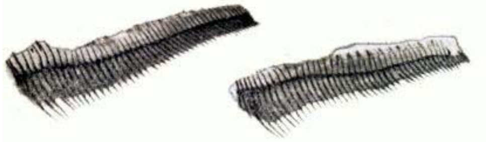
Fig. 3. — Aletas anales coloreadas con alizarina en las que se efectúa el recuento exacto de los radios

tensamente en la región cefálica y predorsal ; una mancha más oscura se encuentra en la región de las narinas. Las aletas presentan el color de fondo, salvo el extremo de la pectoral y el lóbulo superior de la caudal que presentan una mancha más oscura ; barbillas castañas.